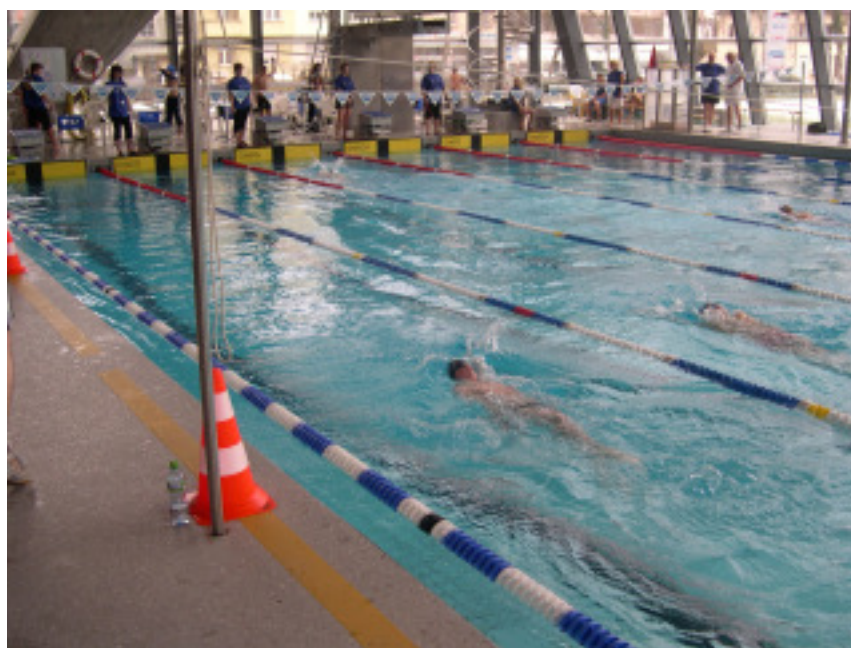
Timon unterwegs zur Bestzeit

Timon schwamm noch 100m Rücken. Auch diesmal teilte er sein Rennen gut ein, 41.45 und 42.60 Dies ergab eine neue persönliche Bestzeit von 1:24.05.